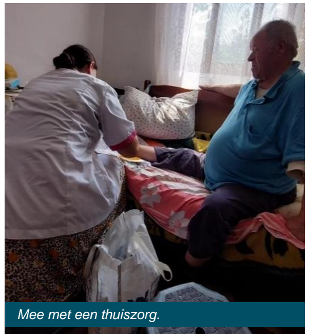
Mee met een thuiszorg.