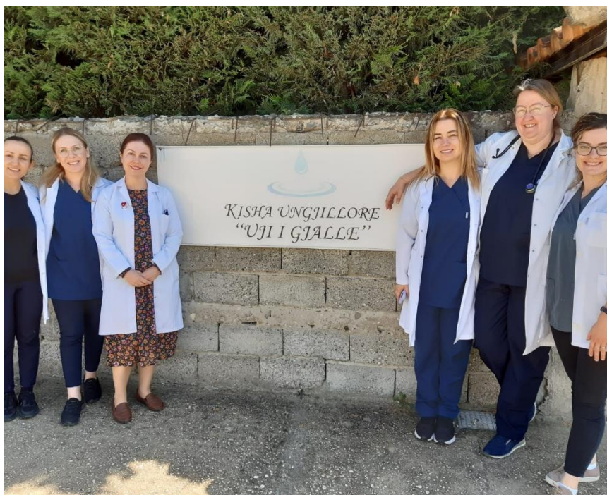
Met het medisch team voor de outreach in Berat.