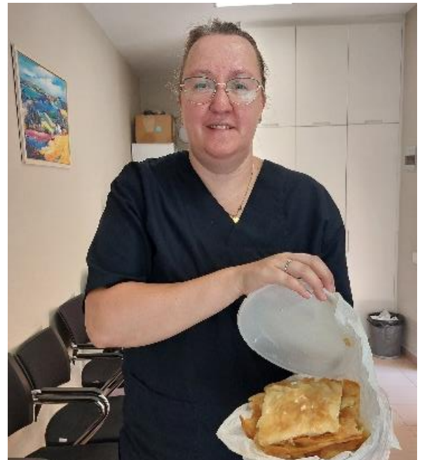
Patiënt heeft 'byrek' gemaakt voor mij.