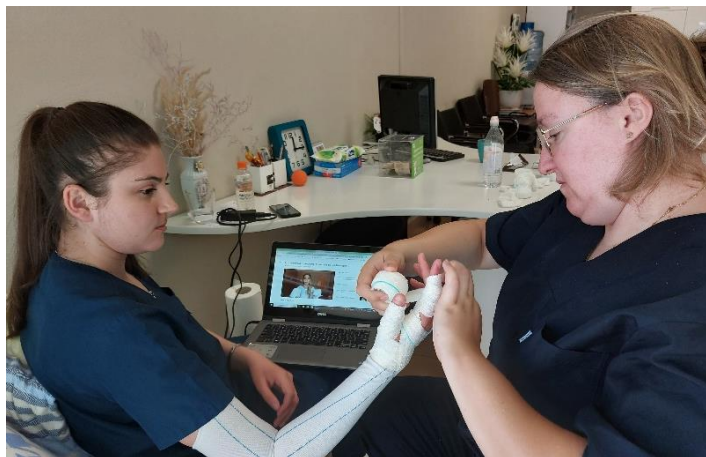
In de kliniek. Een speciale verband techniek oefenen.