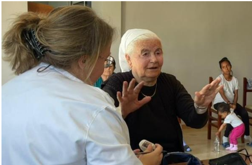
Tijdens de outreach in Savër.

En nog een tweede verzoek. De verhalen vanaf het zendingsveld in Albanië deel ik nu d.m.v. nieuwsbrieven en berichten op social media. Wanneer de taalstudie minder nodig zal zijn en ik mij steeds meer zal richten op het eigenlijke werk zullen er ook meer verhalen en lessen zijn om te delen. Mijn TFC bedenkt volop ideeën om deze verhalen en lessen met jong en ouder te delen. Één van die ideeën is het maken van vlogs. Beelden maken is niet zo moeilijk, maar deze beelden verwerken tot een leuke vlog, dat is andere koek. Ik heb gemerkt dat het mij veel tijd kost, tijd die ik liever besteed aan mijn primaire taken hier in Albanië. Ben jij of ken jij iemand die graag videobeelden bewerkt? Vind je het leuk om mee te denken over de onderwerpen? Vind jij (of diegene die je kent) leuk om dit talent in te zetten voor Gods Koninkrijk? We komen graag in contact met jou en zien uit naar een fijne samenwerking, tot eer van onze goede God!