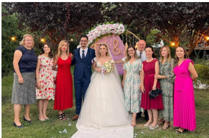
Met het bruidspaar en een groot deel van het ABC-team.